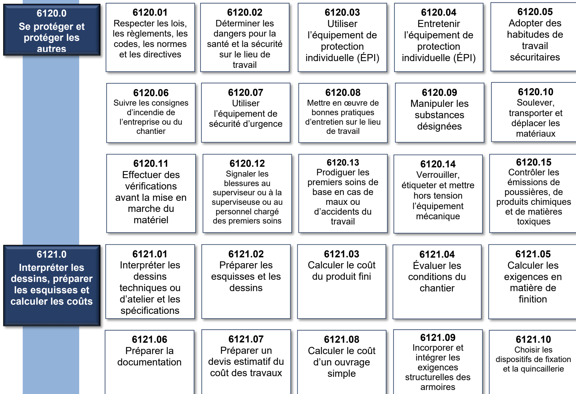
Diagramme Profil d'Analyse des Compétences (PAC)